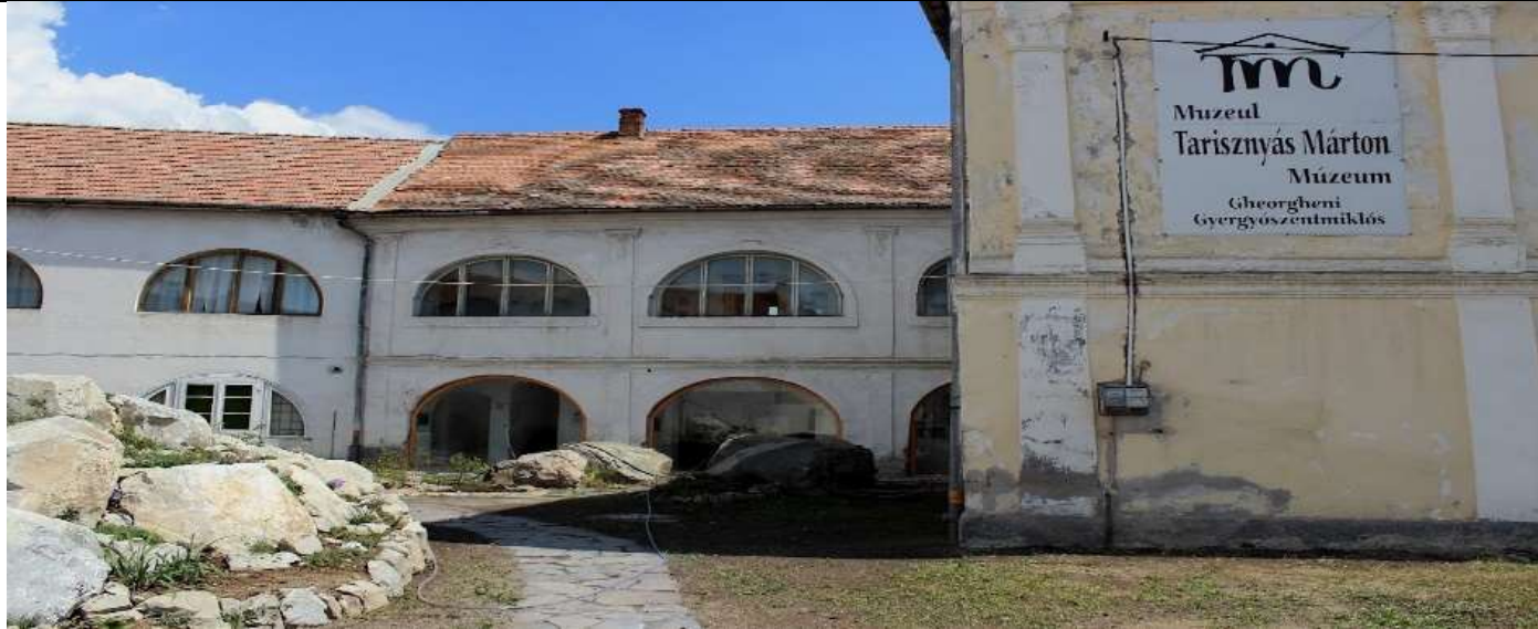
A város múltja, szokásai