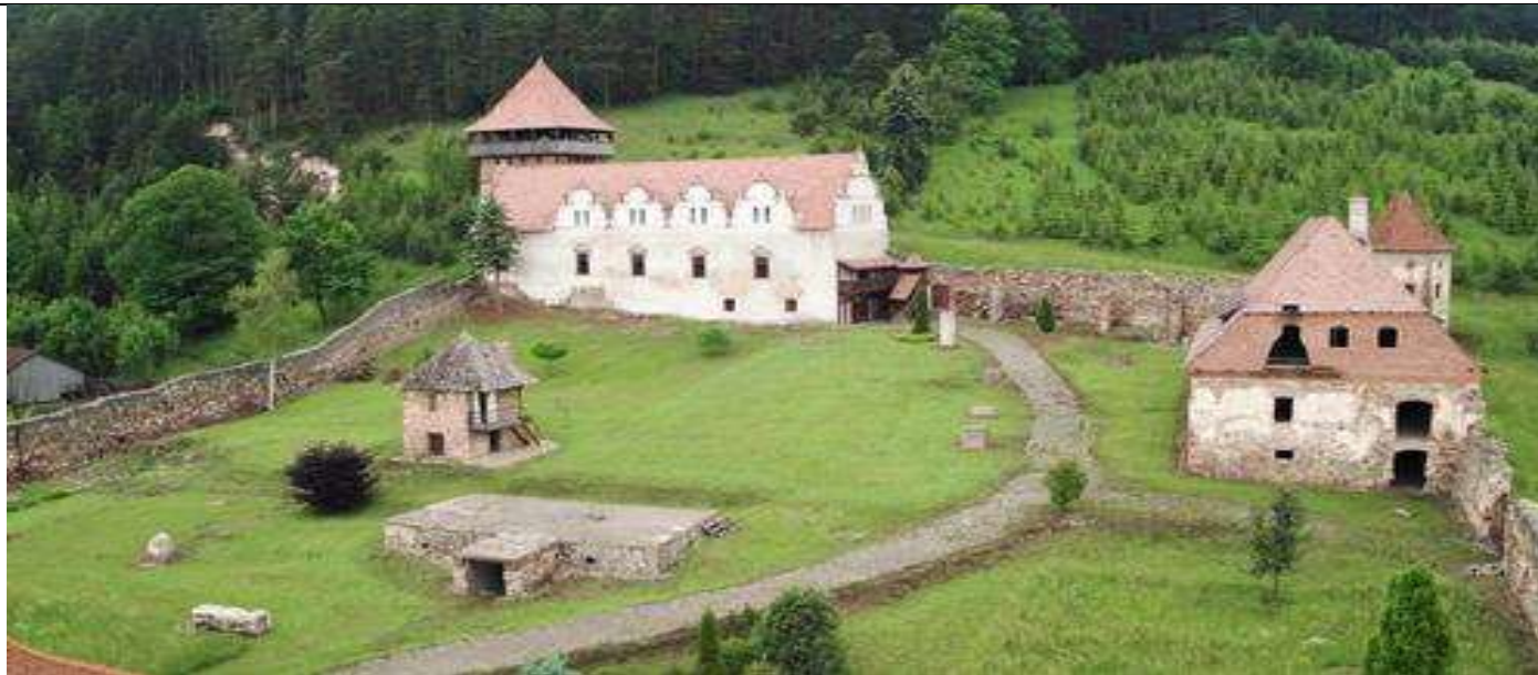
Bethlen Gábor töltötte itt gyermekkorát